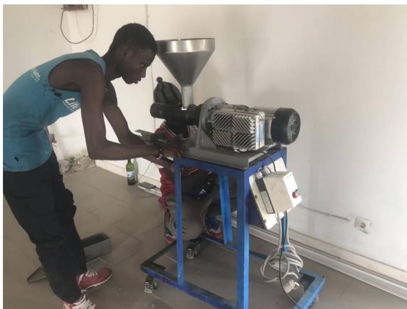
Figure 2-4 : Support de la presse